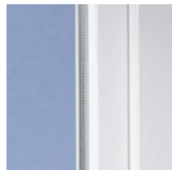
Klassisches Design mit weicher Kontur

Mit modernen Kunststofffenstern aus VEKA Profilen gewinnt jedes Haus. Denn das klassische Design des SOFTLINE Systems mit der leicht abgerundeten Kontur ist zeitlos und harmonisiert hervorragend mit unterschiedlichsten Architekturstilen – ob modern oder traditionell, ob Neubau oder Renovierung.