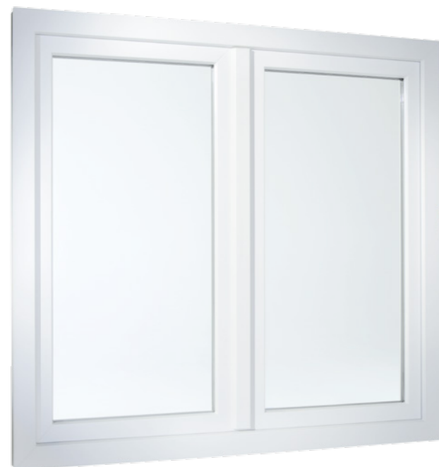
2-flügeliges Fenster in flächenversetzter Variante