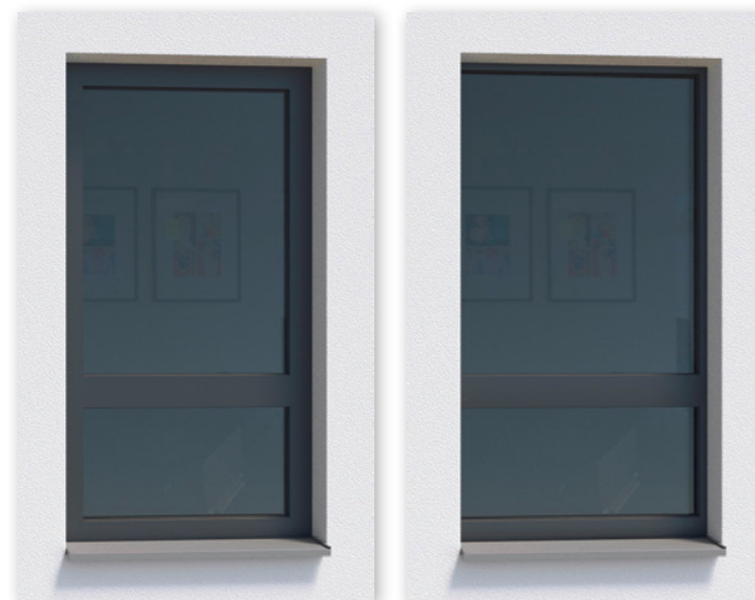
Bild 1: ARTLINE 82 mit verdecktem Fensterflügel – nur der Rahmen ist sichtbar Bild 2: Hier ist der Rahmen nahezu vollständig überputzt, es entsteht eine elegante Ganzglasoptik

Der Fensterflügel liegt vollständig hinter dem Rahmen verborgen und ermöglicht so einen hohen Glasanteil – und damit viel Tageslicht für die Innenräume